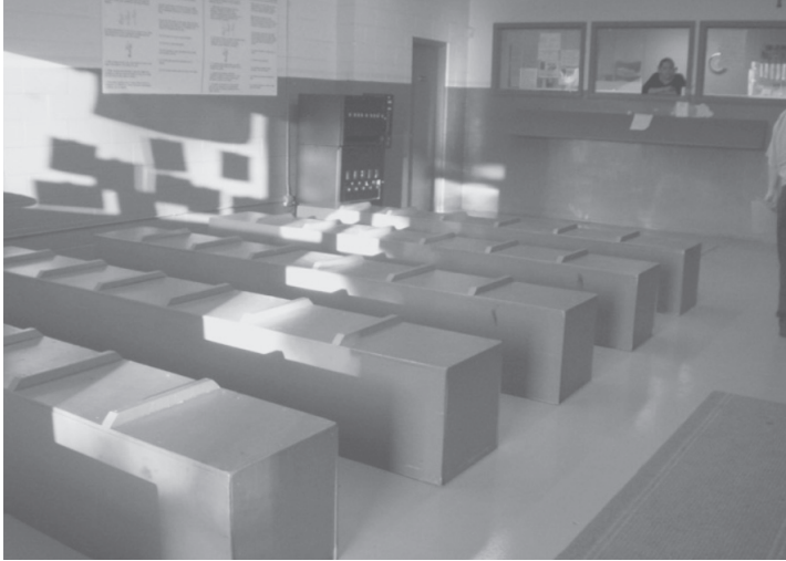
Photo 2 : La salle d'attente typique d'une grande agence de travail journalier dans la banlieue de Chicago (juin 2006)

Au centre de ce dispositif de rétention par l'incertitude se trouve, chez Minute Staff, la liste sur laquelle les candidats doivent inscrire leur nom dans l'ordre de leur arrivée. C'est elle qui est censée déterminer la priorité dans la distribution des postes. En réalité, le dispatcheur utilise la liste de manière différente à différentes occasions, soit en prenant l'ordre indiqué, soit en piochant dedans selon d'autres critères, soit en ignorant complètement. Chez Bob's Staffing, l'autre agence pour laquelle j'ai travaillé, il n'y a pas de liste : la dispatcheuse désigne directement du doigt et demande de s'identifier, ou bien fait l'appel pour reconstituer une équipe créée la veille.